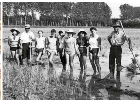
In alto, l'abbazia di Lucedio, del XII secolo che ancora oggi si occupa di agricoltura. Qui sopra, lo specchio delle risaie ai piedi del massiccio del Monte Rosa; l'interno di Sant'Andrea che a settembre ospiterà alcuni eventi di Risò; le mondine in una foto storica.

soddisfare le nuove richieste dei consumatori, oggi l'attenzione dei selezionatori si è concentrata su risi colorati come il Violet e l'Ermes, il primo riso rosso integrale italiano, dalle particolari qualità organolettiche e con coltivazioni più sostenibili sul piano delle risorse idriche.