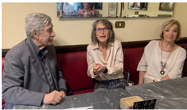
Un momento della conferenza stampa di presentazione

Con la ripresa delle attività dopo la pausa estiva, ricominciano anche le conferenze organizzate dal VercelliViva sul tema 2025 terra d'acqua: lineamenti culturali per un profilo identitario del Vercellese . I prossimi appuntamenti saranno