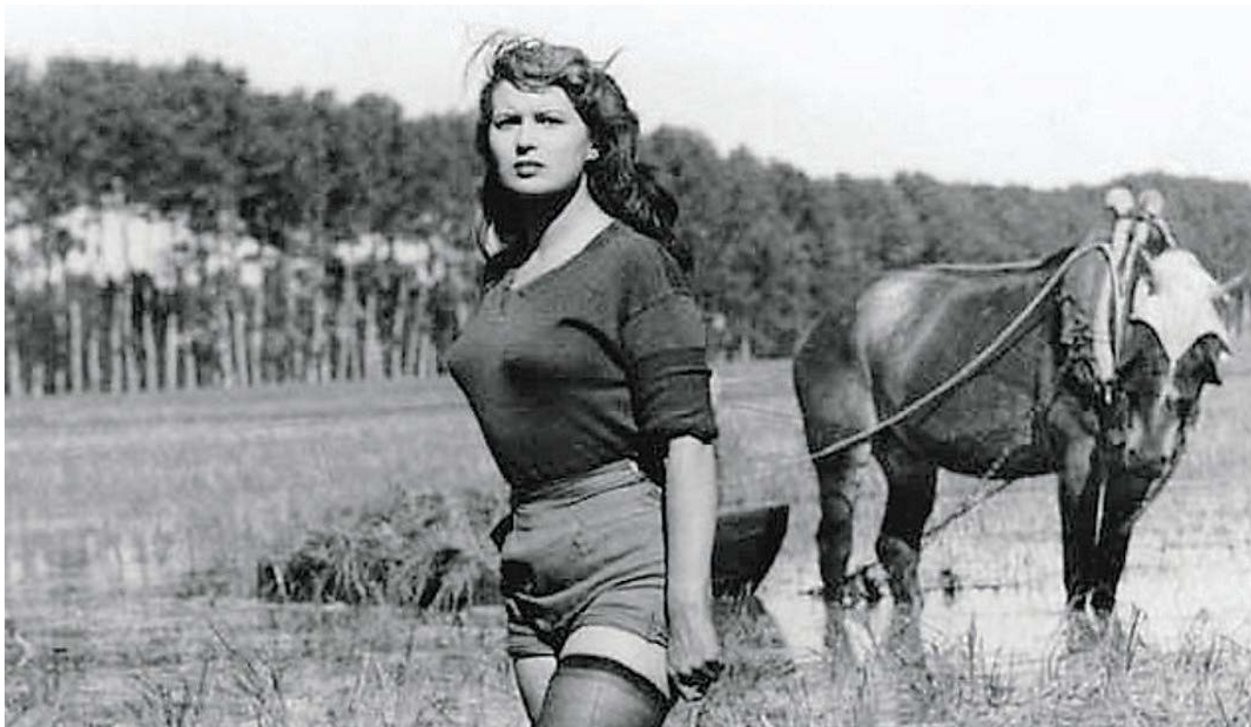
La celebre immagine di Silvana Mangano nel ruolo della mondina protagonista di «Riso amaro»

La presentazione lunedì alle 21 nella Cripta del Sant'Andrea