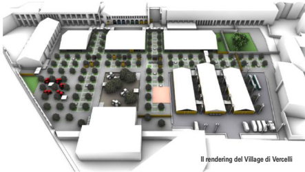
Il rendering del Village di Vercelli

Ad iniziare dal Padiglione Filiera, che vedrà presenti tutte le associazioni di categoria nazionali che rappresentano interessi diversi nel